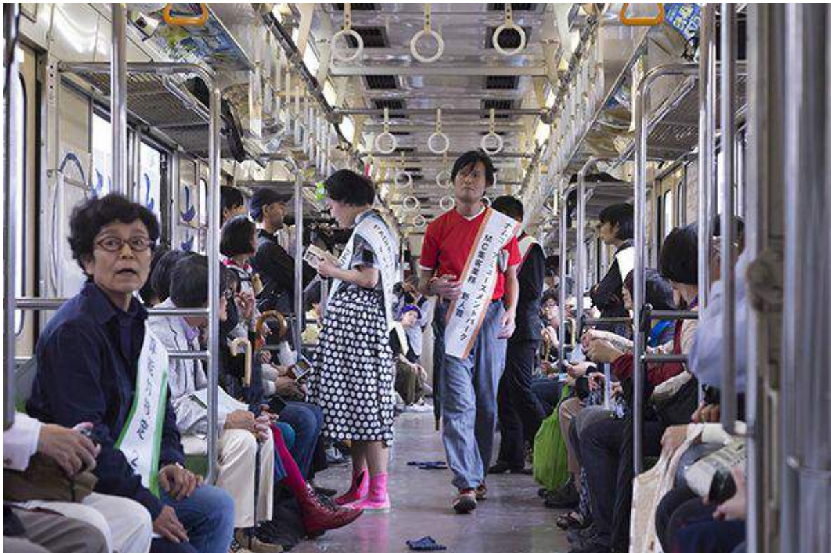
ユン・ハンソル《サイタマ・フロンテージ》 | 2016年