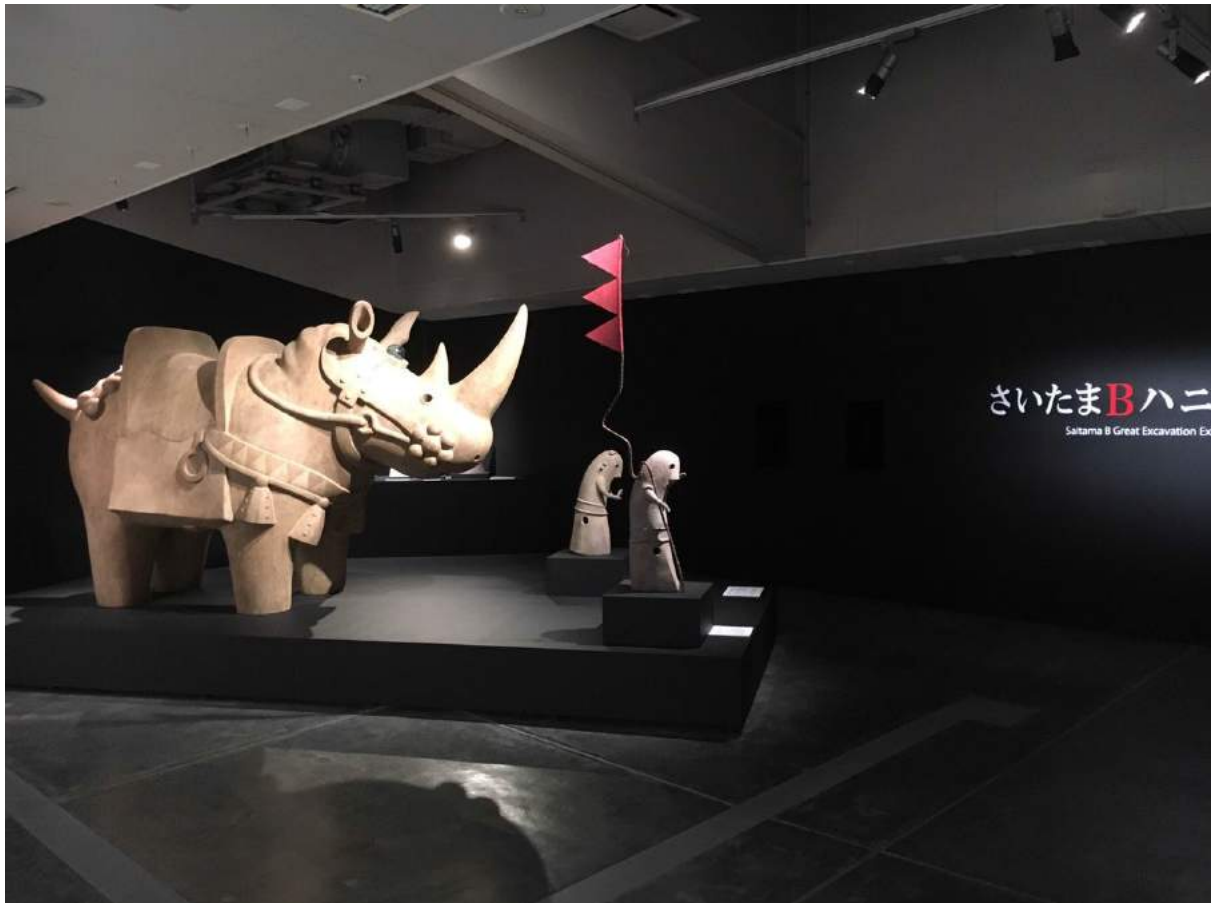
川埜龍三《犀の角がもう少し長ければ歴史は変わっていたらろう》 | 2016年